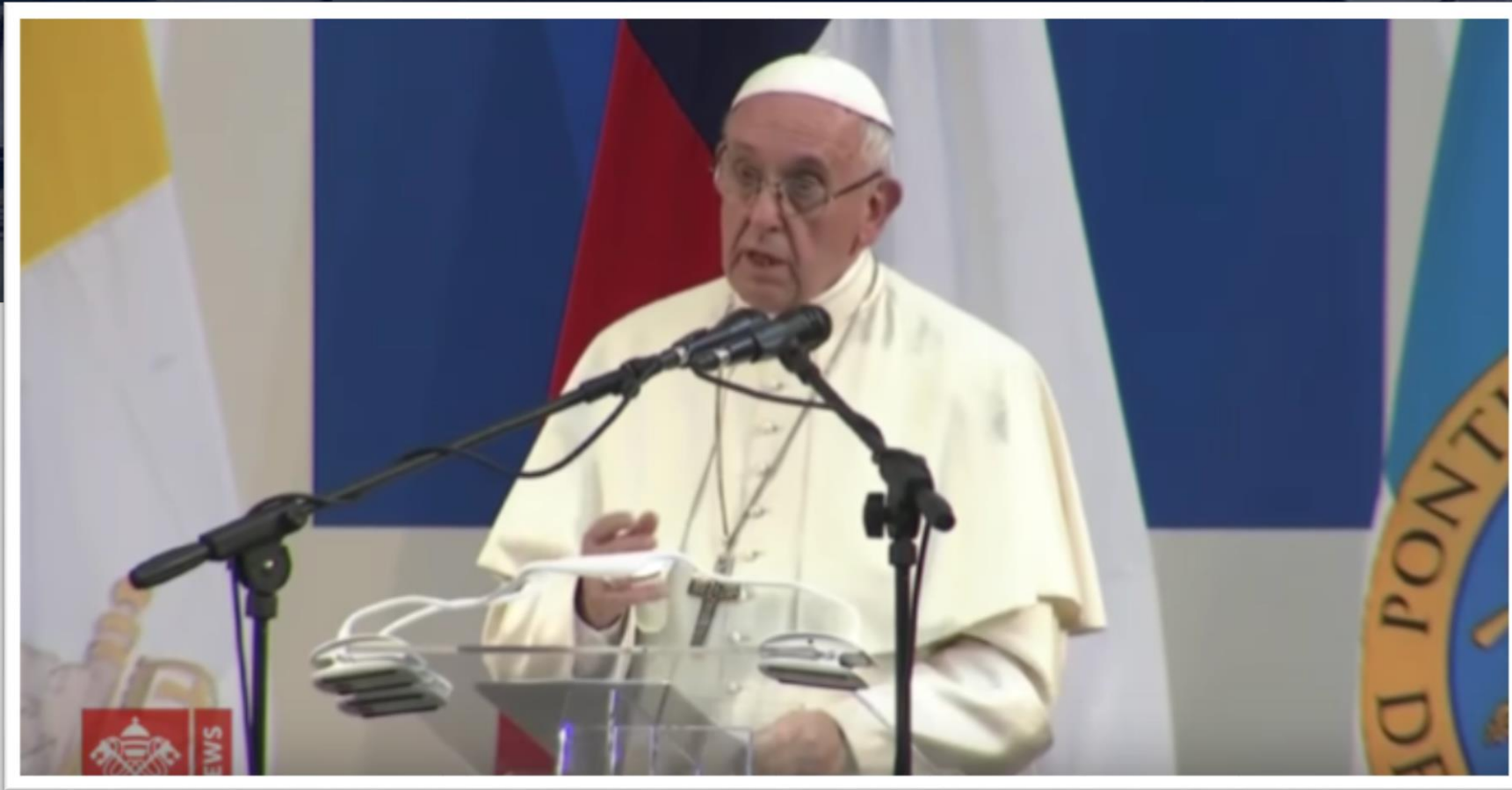
Fragmento del discurso del santo padre en la Pontificia Universidad Católica de Chile Miércoles 17 de enero de 2018, en su viaje apostólico a Chile y Perú.